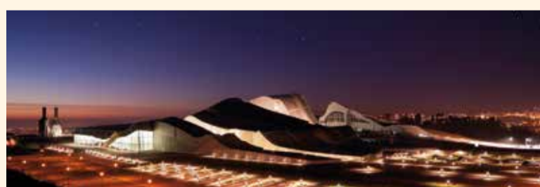
Cidade da Cultura, Santiago de Compostela

À l'intérieur, la province d'A Coruña est constituée de vallées et de grands prés où le bétail paît en toute tranquillité. Grâce à cela, la viande y est d'une excellente qualité. C'est le cas à Santa Comba et Val do Dubra . O Vimianzo (au cœur des Terras de Soneira) dont le centre est occupé par un château datant du XIIe siècle , est un musée vivant où des visites et des activités sont organisées toute l'année.