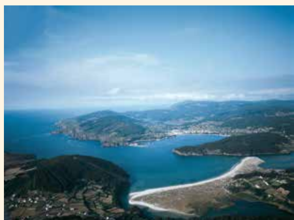
Ria de Cedeira

Le littoral atlantique vous offre, sur la côte de la province d'A Coruña, des paysages imposants constitués de hautes falaises, ainsi que de plages attrayantes et solitaires. En ce qui concerne les falaises, la sierra d'A Capelada (Cedeira) possède les plus hautes de l'Atlantique nord : la côte s'élève, au niveau du mont d'Herbeira, à 620 m au-dessus de la mer. Près de là, le célèbre sanctuaire de Santo André de Teixido , le plus visité de Galice après la cathédrale de Saint Jacques car, comme dit le proverbe populaire, « qui n'y est pas allé de son vivant s'y rendra une fois mort ».