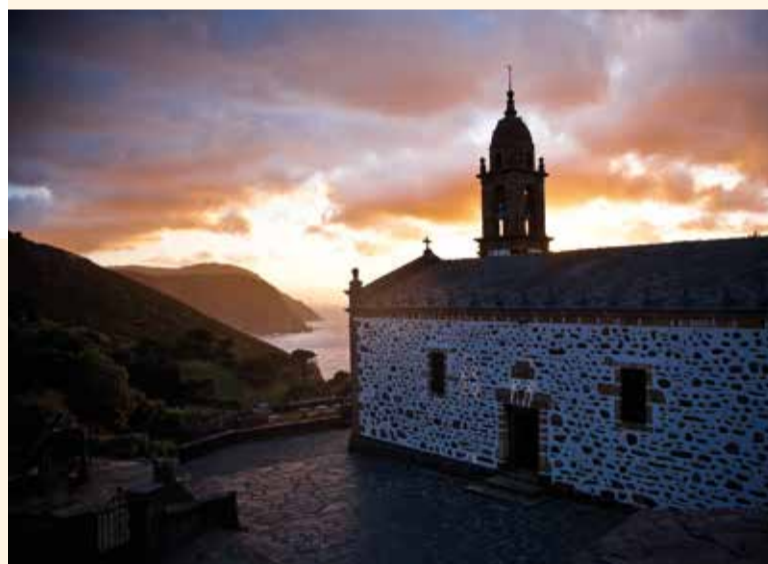
Santo André de Teixido, Cedeira

Dans les derniers kilomètres de la rivière Eume, sur son parcours vers la ria d'Ares, se trouve une des dernières forêts atlantiques d'Europe : les Fragas do Eume , un parc naturel de 9100 hectares qui s'étend à travers un corridor forestier de plus de 20 km de long. Elle abrite des espèces de flore et de faune uniques au monde. Au cœur de la forêt se trouve le monastère de Caaveiro , fondé par saint Rosendo, moine bénédictin, au Xe siècle. Pour apprécier un échantillon de la végétation de ce parc, vous n'avez qu'à suivre les sentiers de la route d'Os Carqueiros , d'environ 8 km (un trajet d'environ 3 heures), qui a comme point de départ le lieu-dit A Pila da Leña (Monfero).