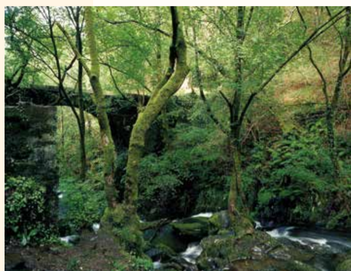
Parc naturel Fragas do Eume

Vous voici arrivé à Compostelle. Le moment est venu de garder vos chaussures de marche et de vous convertir en un voyageur curieux, sensible et actif. Retournez sur vos pas. Tout ce que vous avez pu voir ou dont vous avez pu profiter sur votre route vous attend. D'autres chemins s'ouvrent à vous, tout aussi séduisants. Regardez tout ce que nous avons préparé pour vous.