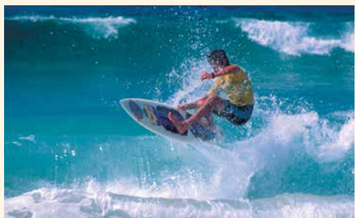
Championnat mondial de surf « Pantin Classic Galicia Pro »

Vers le nord, vous arriverez à la ria d'Ortigueira , protégée par le Cap Ortegal et Estaca de Bares (c'est ici que se trouve la séparation entre l'Océan Atlantique et la mer Cantabrique, et c'est un excellent observatoire d'oiseaux). À Ortigueira se célèbre, tous les mois de juillet, le Festival International du Monde Celta , qui est arrivé à rassembler plus de 100 000 personnes pendant certaines éditions. Combinez musique et paysages saisissants. Comme la ria d'O Barqueiro , une des plus petites de Galice ; son port est un mirador de maisons blanches qui couvrent le coteau. Et aussi dans cette ria, Bares, dont la digue conserve le souvenir millénaire du peuple phénicien, auquel on en attribue la première construction.